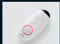
Dálkové ovládání ve výbavě

WASHLET Giovanni je výsledkem mezinárodní spolupráce společnosti TOTO a slavného italského designéra Stefano Giovannoni.