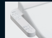
Pevně namontovaný ovládací panel; přímo na zařízení WASHLET

Základní model mezi zařízeními WASHLET, nabízí osvědčené technologie TOTO: