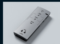
Dálkové ovládání ve výbavě

WASHLET s čisticí a antibakteriální technologií ewater+ a všemi standardy, které nabízí i ostatní zařízení WASHLET od TOTO.