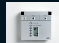
Dálkové ovládání ve výbavě

WASHLET GL je klasický japonský WASHLET s vysokým komfortem: